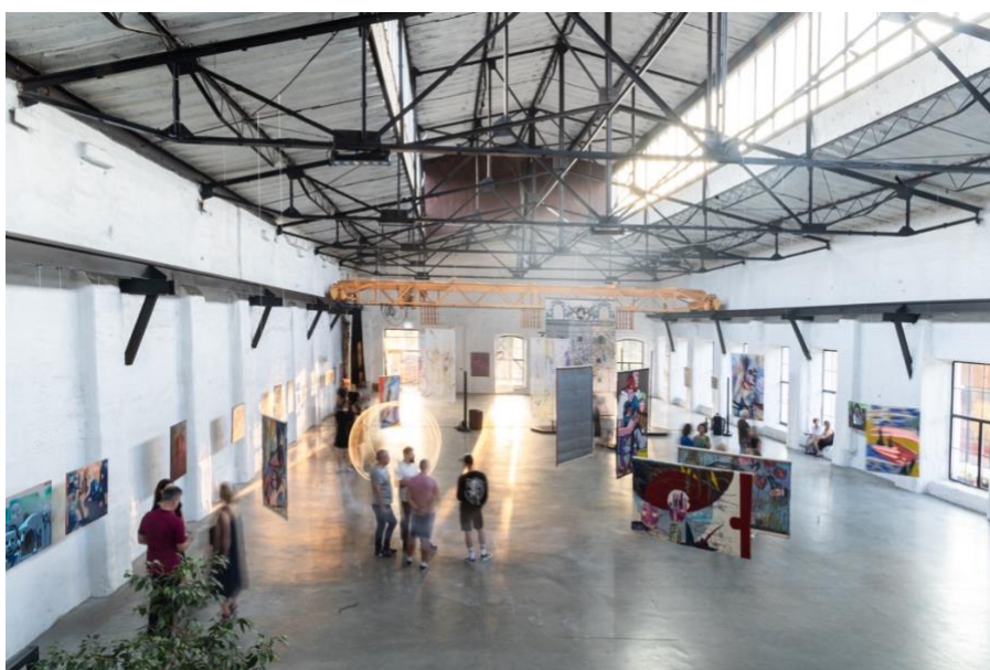
Paroda Dienoraščiai veikia iki lapkričio 29d.

Photos from our recent exhibition Diaries which will run until end of November