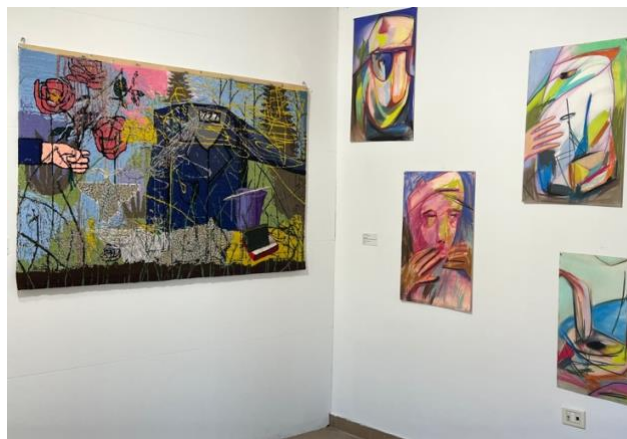
The Others Art Fair Turine, Italijoje lapkričio 1-5d.